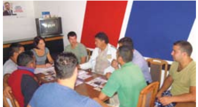
Састанак са представницима Удружења Рома у Белој Паланци