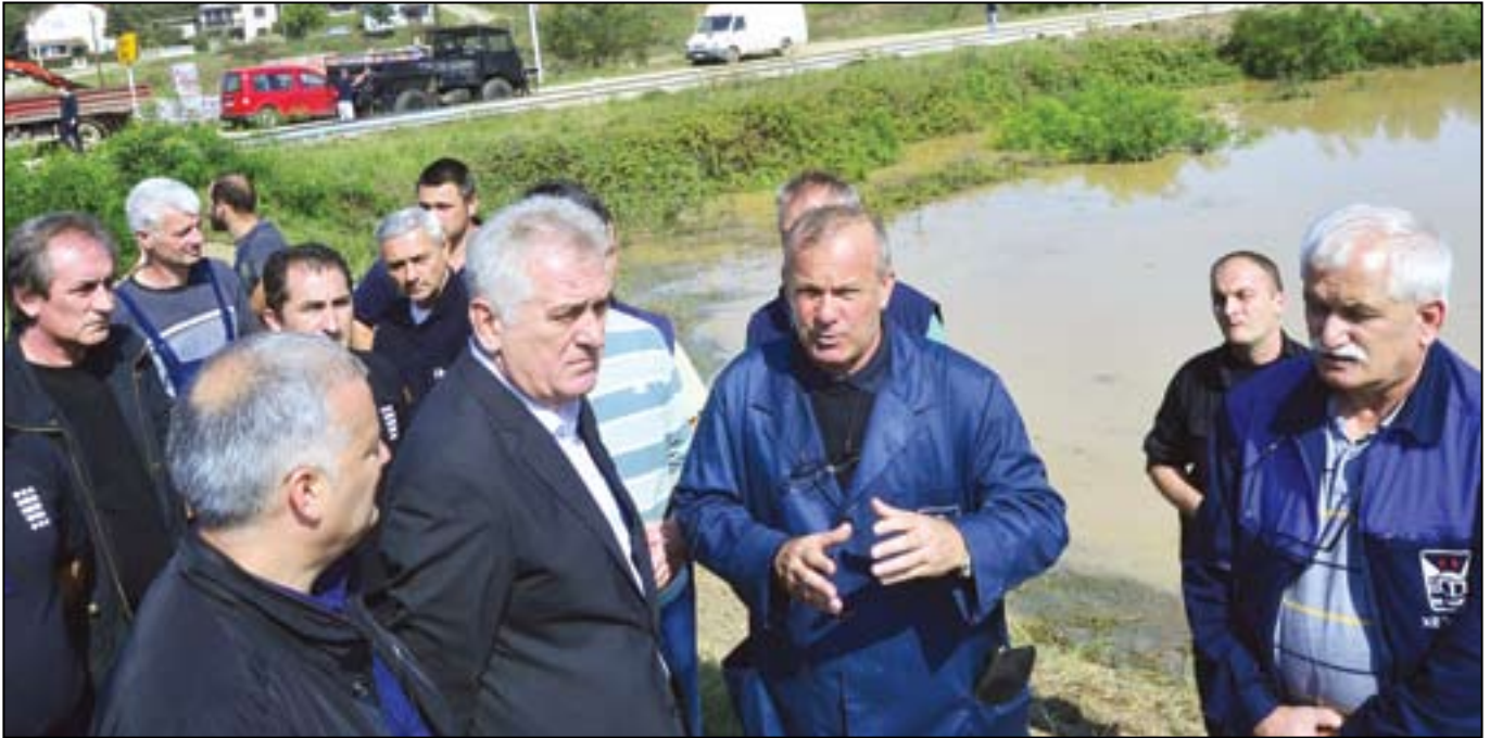
Председник Томислав Николић у разговору са грађанима погођеним поплавама и клизиштима

Председник Србије, Томислав Николић, посетио је поплавлена домаћинства у селу Грабовица, у Општини Кладово, и рекао да следи процена штете и сагледавање колико држава може да помогне угрожена подручја, како би се лакше дочекала зима.