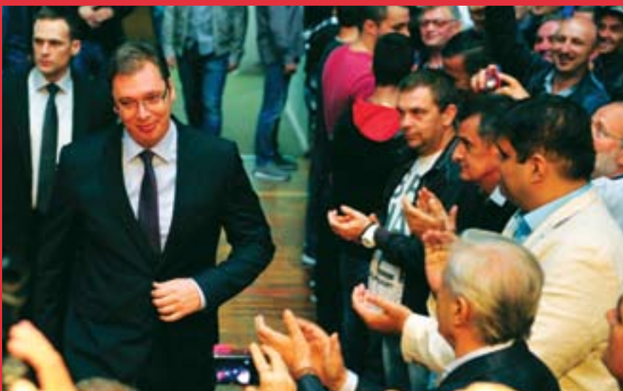
Дочек премијера Вучића на предизборном митингу у Мајданпеку