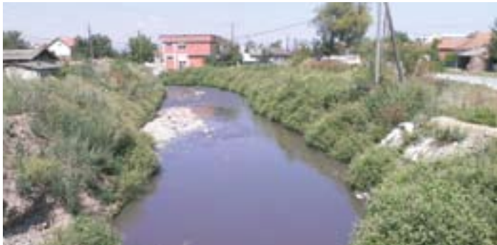
Уређење корита реке Приштовке у Косовом Пољу