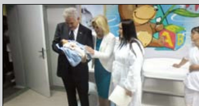
Драгица и Томислав Николић у реновираном породилишту у Врању

Фондација је тренутно све снаге и средстава усмерила за помоћ угроженом становништву у поплавама. У изради је десет монтажних кућа за најугроженије у околини Уба, Варварина, Бајине Баште, Свилајнца, а адаптира се више стотина кућа у околини Краљева и осталих места која су била погођена поплавама и клизиштима. Ове куће биће опремљене потребним намештајем. Фондација је, заједно са председником Републике, Томиславом Николићем, до сада уручила више од два милиона хуманитарне помоћи становништву у свим поплављеним подручјима Србије.