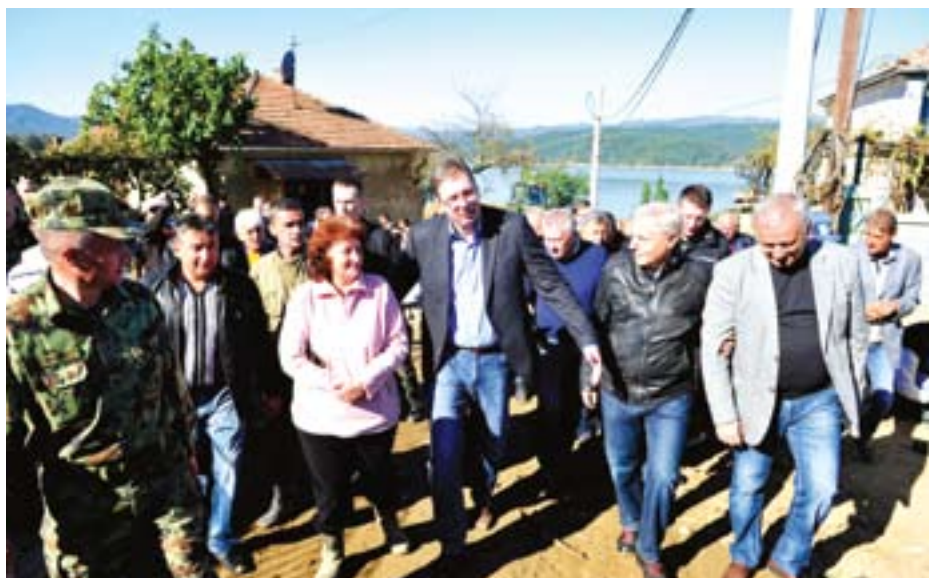
У разговору са грађанима Текије, приликом обиласка радова на санацији штете од поплава