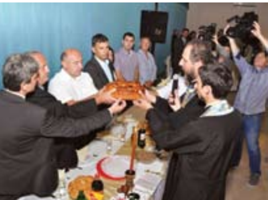
Прослављена слава у Блацу

Омладинци ОО СНС Блаце дали су изузетан допринос у организацији манифестације Дани шљиве, а низом пројеката допринели