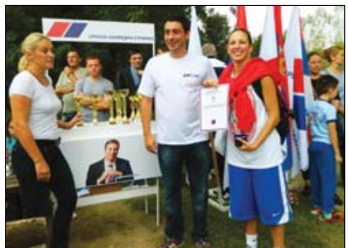
Даме су се такмичиле у четири дисциплине - кошарци, пикаду, одбојци и кувању у котлићу