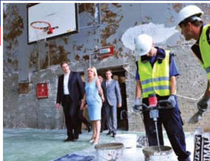
Радови на реконструкцији Основне школе „Јован Јовановић Змај“ требало би да буду завршени до 15. октобра