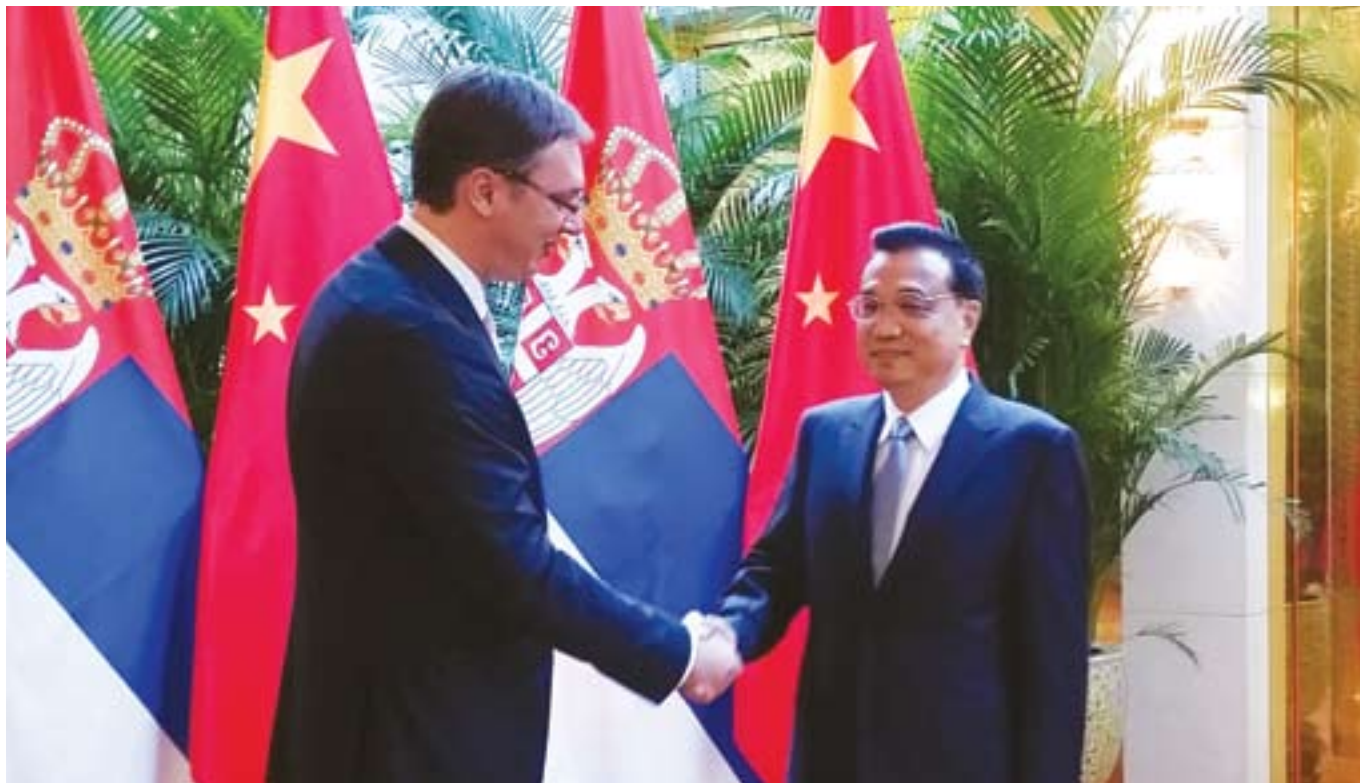
Премијер Србије, Александар Вучић, са Лијем Кећангом, премијером Народне Републике Кине

Током посете премијера Александра Вучића Народной Републици Кини, договорена је изградња брзе пруге Београд - Будимпешта, формирање слободне економске зоне, посета кинеског премијера Ли Кећанга Србији, као и заједничка организација Самита 16 шефова влада земаља Централне и Источне Европе у Београду