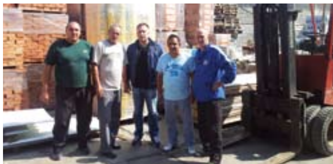
Спремљен грађевински материјал за Доњу Трешњицу