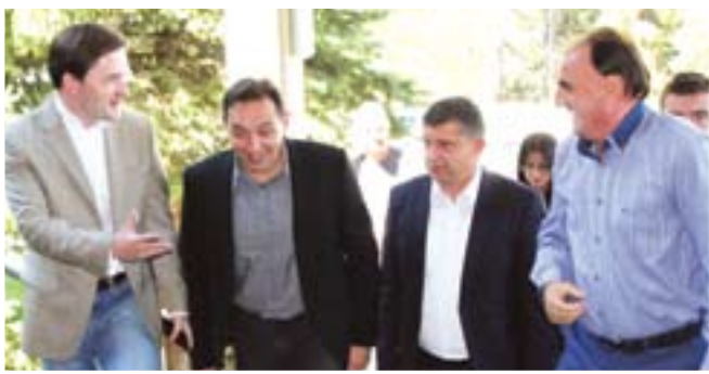
Министри у Новој Вароши