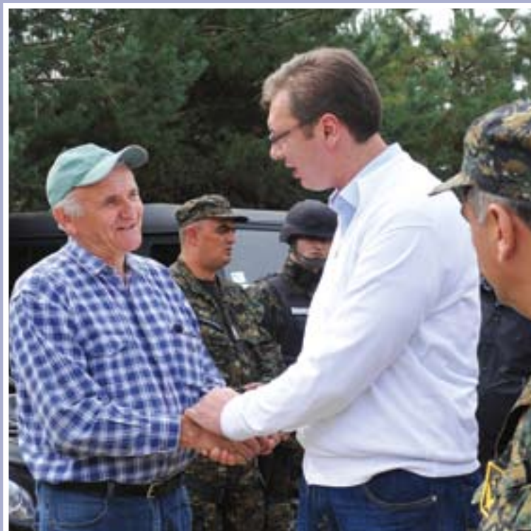
Премијер са грађанима Мердара

Премијер Вучић састао се у Влади Србије са боксерским прваком, Муамером Хукићем, који је 13. пут одбранио титулу професионалног првака света.