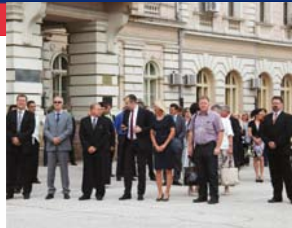
Прослава Дана града у Бечеју

У склопу редовних страначких активности, председница ОО СНС Мол – Ада,