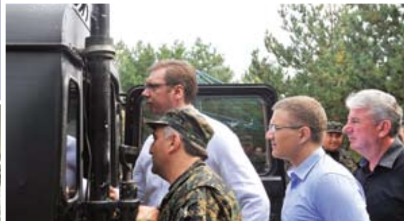
Премијер Вучић и министар Стефановић на састанку са припадницима Жандармерије у бази Мердаре