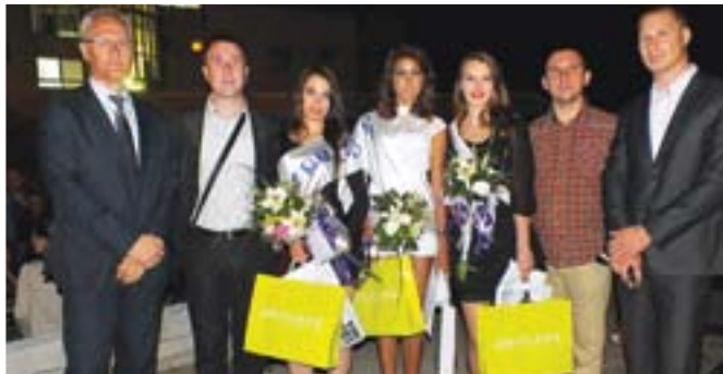
Вински бал у Власотинцу