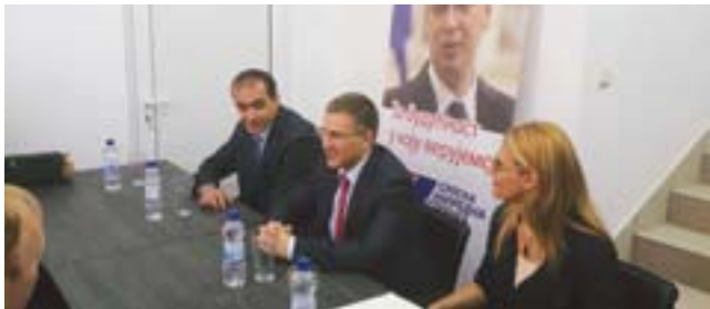
Небојша Стефановић на састанку у Врању