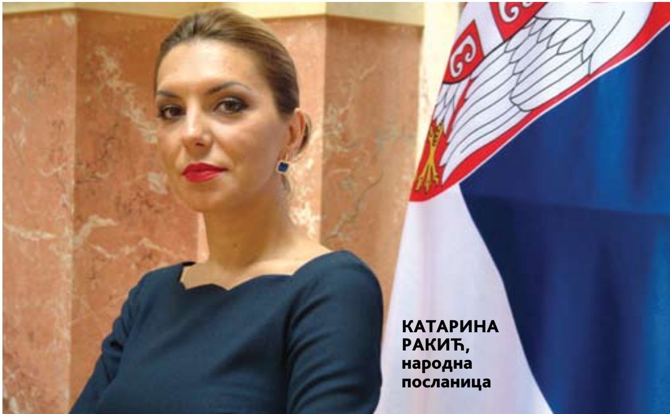
КАТАРИНА РАКИЋ, народна посланица